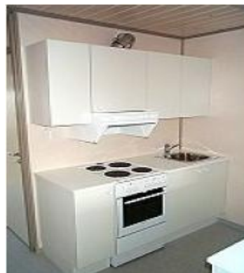
Køkken i beboelsesmodul