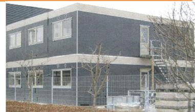
Klassisk pavillon løsning

AGJ standard pavilloner kan sammenbygges til utallige løsninger